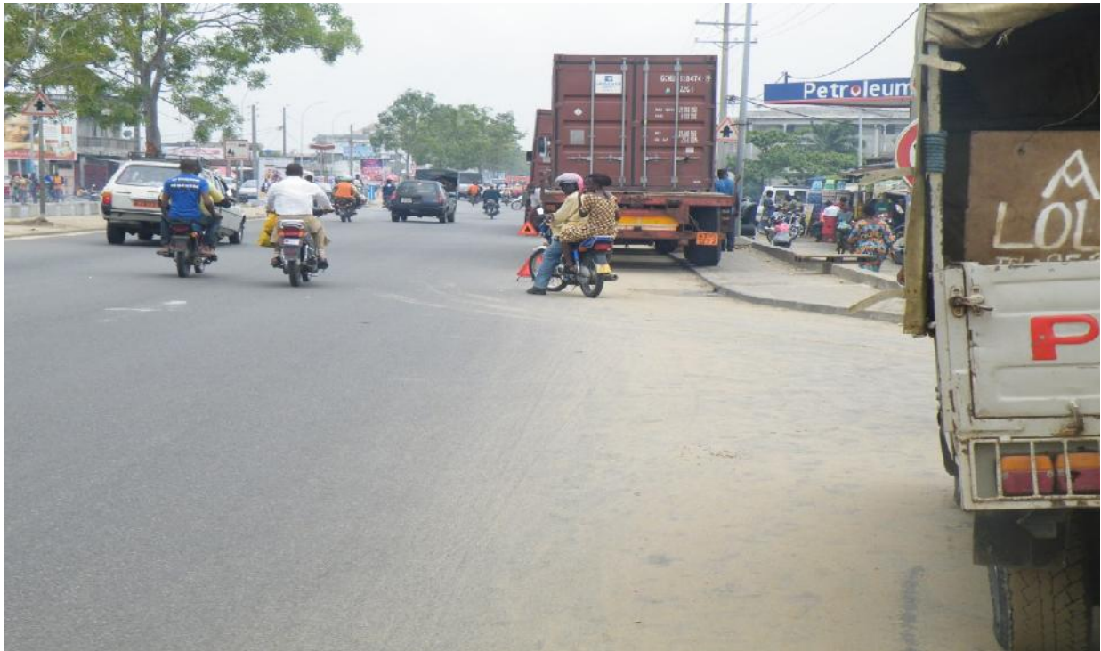
Photo 3 : Entre les buvettes, les vendeurs et les véhicules en stationnement, les trottoirs ne sont même plus accessibles pour les personnes handicapées.