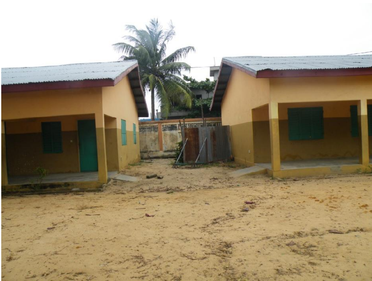
Photo 2 : ...Or des rampes bien faites peuvent (en partie !) soulager l'utilisateur handicapé moteur