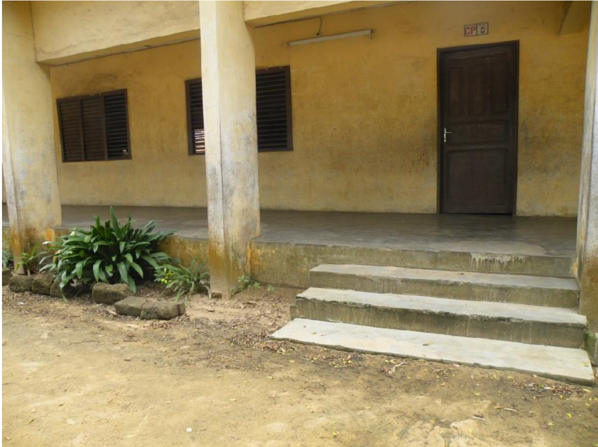
Photo : Difficulté d'accès aux salles de classe : entre sol humide et marches trop élevées

Exemple d'une école à Cotonou : il est de notoriété publique que beaucoup de quartiers à Cotonou sont inondés en saison de pluie. En conséquence, les marches (escaliers) des salles de classe sont surélevées. Par ailleurs, les cours des écoles sont très sablonneuses. Comment un écolier handicapé, avec son fauteuil roulant ou tricycle peut-il aisément accéder à sa salle de classe ?