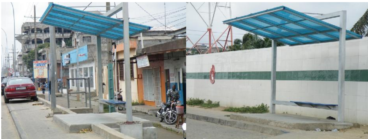
Figure 1 : Deux (02) arrêts de bus en cours d'aménagement dans la ville de Cotonou...